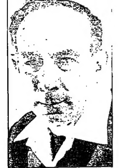
البنية على ص ٨ ع ٧

لندن - اعلن امس موظفون بريطانيون مسؤولون ان طائرات تجسس سوفياتية زارت بريطانيا الاسكتلندية فوق سواحل بريطانيا شرقية نسبة دة بالمائة في السنة الاخيرة . وجاء في بيان هؤلاء الموظفين ان طائرات مقاتلة بريطانية اجبرت طائرات تجسس سوفياتية من طراز « جيان » على الفرار غير ان في اية مرة من هذه المرات لم تدخل الطائرات السوفياتية مجال بريطانيا الجوي . وتعمل الطائرات السوفياتية هذه اجهزة تعقب الكرونية .